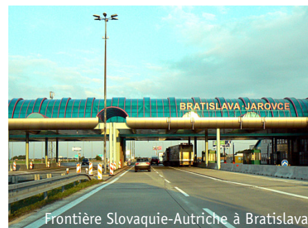
Frontière Slovaquie-Autriche à Bratislava

Depuis le milieu des années 2000, les partenaires de TTR-ELAt travaillent ensemble pour devenir encore plus compétitifs à l'international grâce aux échanges transfrontaliers. De nombreuses relations de ce type se sont nouées et les autorités publiques