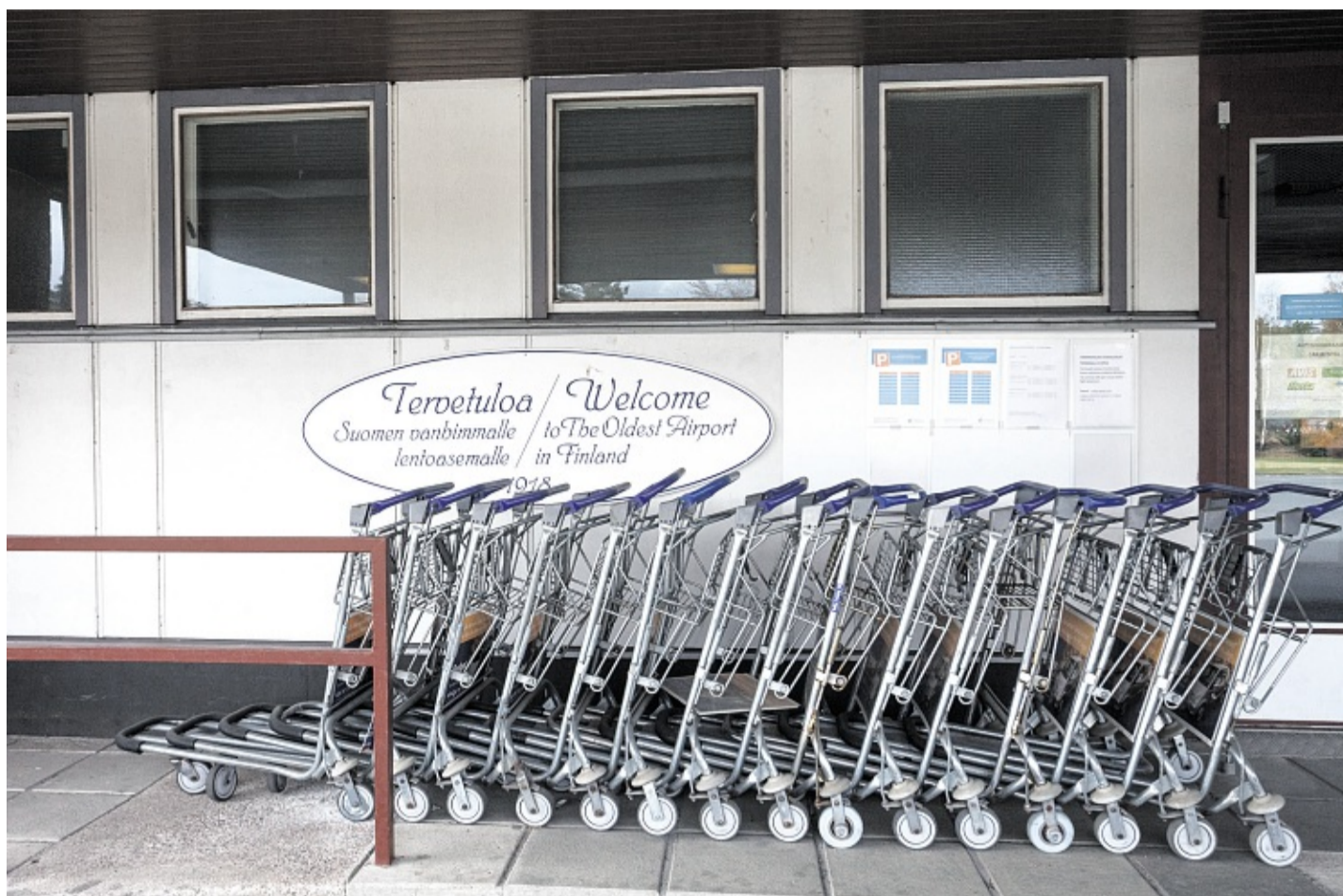
L'aéroport de Lappeenranta est surtout utilisé par les Russes qui viennent profiter des vols low-cost.

La fréquentation de la frontière est indexée sur le cours du rouble. En 2008, la monnaie russe s'était effondrée, à la suite de la crise financière internationale, entraînant dans sa chute le trafic transfrontalier. Depuis, les passages ont repris leur essor, jusqu'à ce que, cette année, les mêmes causes produisent les mêmes effets. Depuis le début de la crise ukrainienne, le rouble a reculé d'environ 10 %, et une nouvelle fois, les Russes se