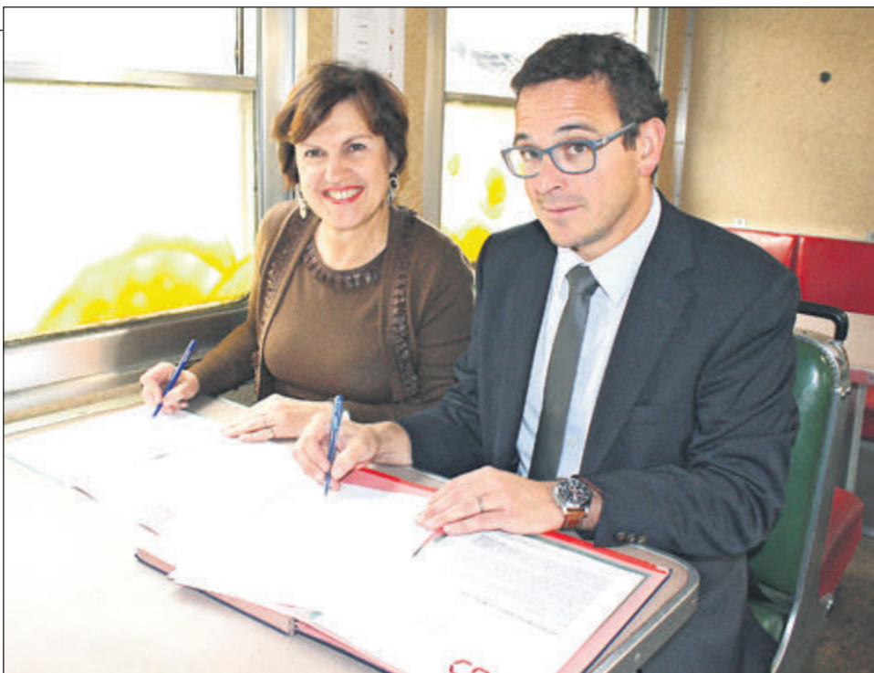
L'abandon du programme "Deux populations, un pays" ne remet pas en cause les relations franco-suisse à travers l'A.U.D..

lers-le-Lac, Les Fins) chacune participant au prorata de son nombre d'habitants. Mais voilà, "Deux populations, un pays" est ajournée à cause des difficultés financières que rencontre actuellement la ville de La Chaux-de-Fonds. La commune qui compte 40 000 habitants ne versera pas au programme les 20 000 francs suisses qui lui incombent. "Notre budget communal 2016 prévoit un déficit important. Le Conseil communal a donc décidé de ne pas s'engager dans de nouvelles contributions. Le projet "Deux populations, un pays" qui n'était pas encore en place a été jugé non prioritaire" indique l'Hôtel de Ville. Le programme n'est pas abandonné, mais décalé dans le temps. Il a néanmoins du plomb dans l'aile, car il n'est pas certain que les co-financiers, en dehors des six communes de l'A.U.D. maintiendront ce niveau