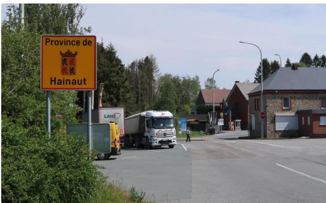
Pour faire escale dans le Hainaut, province belge voisine de la Thiérache, il faudra montrer patte blanche, ou plutôt un test négatif au Covid, à partir du jour de Noël.