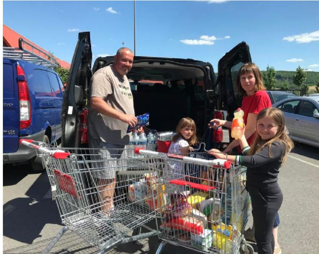
Comme cette famille venue de Dinant, ils étaient des centaines de Belges à avoir investi la zone commerciale Rives d'Europe à Givet dès samedi matin.