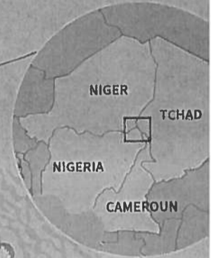
Carte réalisée avec l'aide de l'Afrique contemporaine et de cartographie Ed