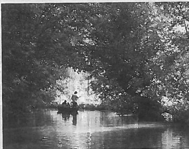
Le programme Leader s'attache au développement économique des territoires ruraux sur les activités telles que le numérique, les services, le tourisme, etc.

En France, le programme devrait se déployer sur 300 territoires d'ici à la fin de l'année, alors qu'ils étaient 223 jusqu'à présent. Le développement des services aux habitants sur le territoire et le soutien de la transition énergétique et l'économie numérique sont les priorités thématiques qui inspirent le plus les groupes bâtis sur la base de territoires de projets (pays, parcs naturels régionaux et pôles d'équilibre territorial). Selon Gwenaël Doré, le nouveau Leader se présente sous de bons augures. « Le transfert de la gestion du programme des directions régionales de l'alimentation, de l'agriculture et de la forêt vers les