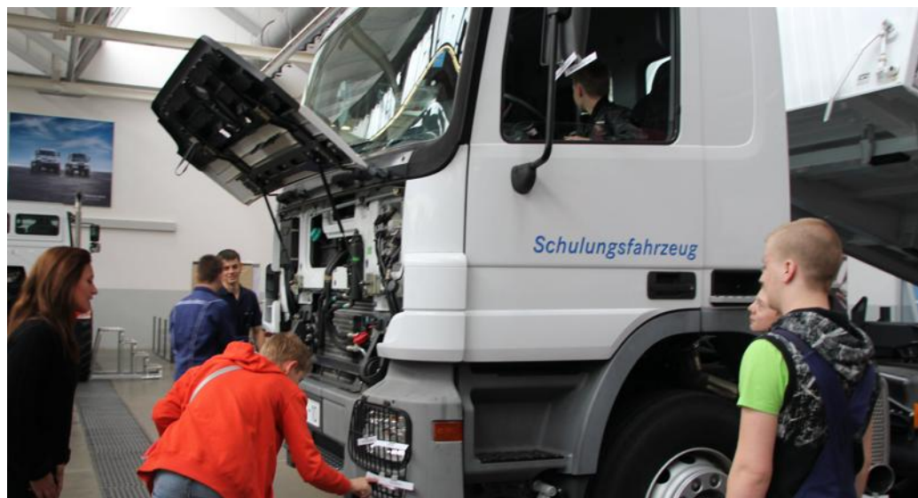
Les élèves ont découvert l'entreprise Daimler à Wörth (Palatinat) de manière ludique : en localisant les différents composants des camions (photo de gauche) et en apprenant à mettre une pièce en place sans voir ce que l'on fait (photo de droite).

Après quoi les élèves ont visité deux entreprises : Daimler à Wörth, le plus gros site qui fabrique les camions Mercedes et Hor-