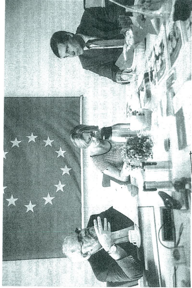
Bureau du Service de placement transfrontalier entre la France et l'Allemagne, à Sarrebruck, en juillet 2014. La Sarre se donne trente ans pour devenir la « passerelle » des échanges franco-allemands.

Le gouvernement sarrois mise lui aussi sur la langue. « Entreprises et particuliers français doivent trouver ici les compétences dont ils ont besoin, et des partenaires qui les comprennent », dit Annegret Kramp-Karrenbauer. Sa « stratégie » prévoit donc de former, d'ici à 2043, une génération de Sarrois bilingues. Progressivement, l'enseignement du français doit être généralisé, de la crèche au lycée – sans sacrifier l'anglais, si cher aux parents d'élèves que le Bade-Wurtemberg, Land voisin de l'Alsace, avait dû renoncer, dans les années 2000, à instituer le